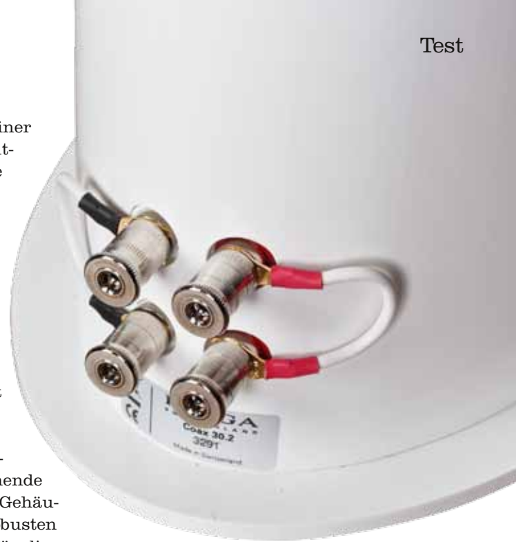
Die Lautsprecheranschlüsse stammen von WBT. Sie sind sehr stabil ausgeführt und nehmen alle Steckverbindungen auf

Die Hoch-Mitteltoneinheit ist als koaxiales Bändchen ausgelegt. Piega bezeichnet dies als C2-System